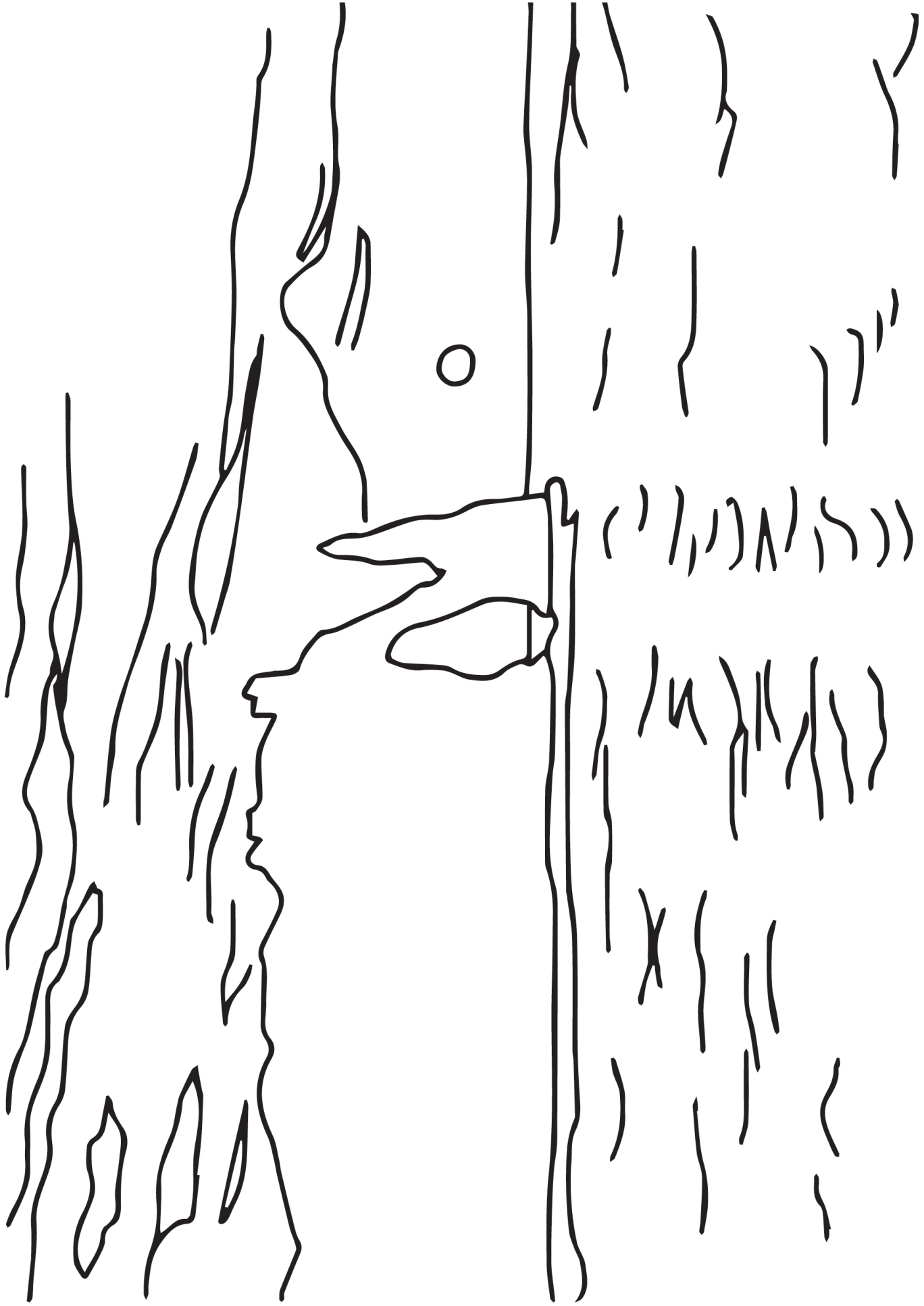
Descripción de la imagen: Una página para colorear de The Cliff, Étretat, Sunset (El acantilado, Étretat, atardecer) de Claude Monet.