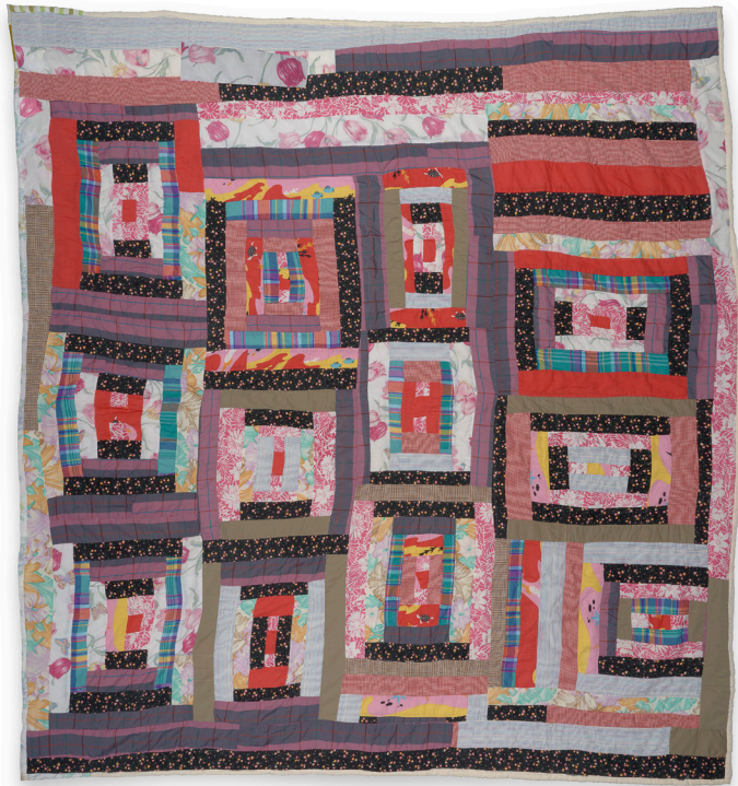
Lucy Mingo, Variación "Tejado"—"Cabaña de madera" , circa 1985, mezcla de algodón y poliéster, 97 x 85 in, Colección de la Fundación Souls Grown Deep; © 2023 Lucy Mingo/Artists Rights Society (ARS), New York

Crea una bandera de tela vibrante inspirada en un edredón de Lucy Mingo.