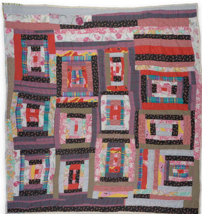
Lucy Mingo, "Housetop"—"Log Cabin" Variation, circa 1985, cotton and cotton/polyester blend, 97 x 85 in., Collection of the Souls Grown Deep Foundation; © 2023 Lucy Mingo / Artists Rights Society (ARS), New York

Create a vibrant banner from fabric, inspired by a quilt made by Lucy Mingo.