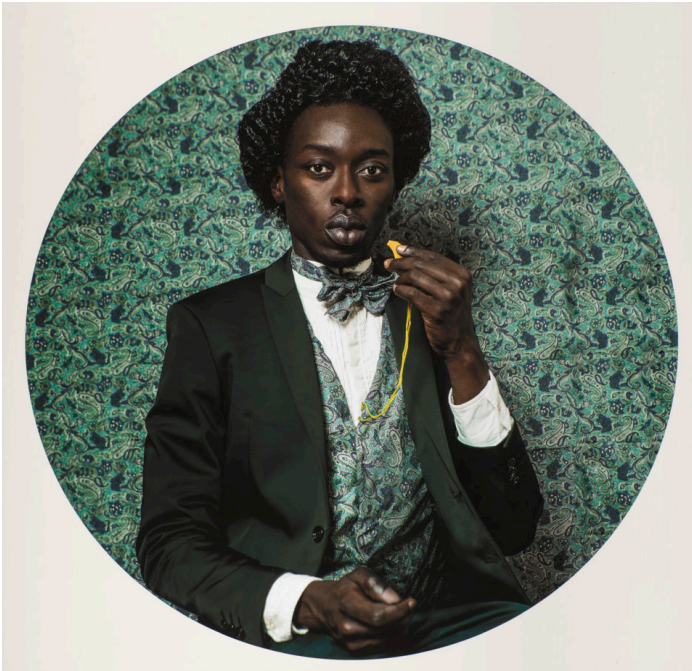
Omar Victor Diop, Frédéric Douglass , 2015, pigment inkjet on Hahnemühle photo paper, 23 5/8 x 23 5/8 in., Purchased with funds from the Friends of Photography

Create a dramatic self-portrait drawing inspired by artist Omar Victor Diop.