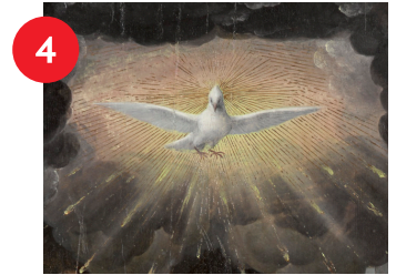
4 Follower of Bernard van Orley, The Pentecost (detail), circa 1530, oil on panel, 37 1/2 x 43 3/4 in., Purchased with funds from the State of North Carolina State

A majestic swan fends off an attack from a dog on the hunt. The drama in the animals' poses would have delighted the French king Louis XV and his court.