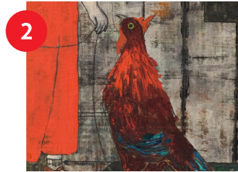
Harriet Bogart, Little Girl with Chicken (detalle), siglo XX, óleo sobre tabla, 12 x 9 15/16 in., comprado con fondos de la Sociedad de Arte del estado de Carolina del Norte (legado de Robert F. Phifer).

Encuentra esta escultura inspirada en un ave marina llamada zarapito o sarapico . ¿Puedes ver su pico largo y curvo reflejado en las curvas de la escultura?