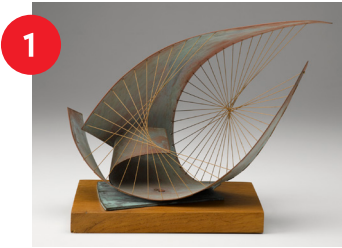
Barbara Hepworth, Stringed Figure (Curlew) (maqueta), 1956, latón y cuerdas de algodón con base de madera, Alt. (sin base) 9 1/8 in. x Anch. 7 in. x Prof. 13 in., legado de W. R. Valentiner.

¡Hay una bandada que espera ser descubierta en las galerías del North Carolina Museum of Art! ¿Puedes encontrar a todos los amigos alados que aparecen en las siguientes obras?