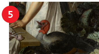
5 Attributed to Pieter Cornelisz. van Rijck, Still Life with Two Figures (detail), 1622, oil on canvas, 49 5/8 x 58 1/4 in., Purchased with funds from the State of North Carolina

In Christianity the Holy Spirit can take the form of a dove . Find a painting where a radiant dove appears during a feast celebration called Pentecost.