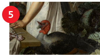
Atribuido a Pieter Cornelisz. van Rijck, Still Life with Two Figures (detalle), 1622, óleo sobre lienzo, 49 5/8 x 58 1/4 in., comprado con fondos del estado de Carolina del Norte.

Para los cristianos, el Espíritu Santo puede tomar la forma de una paloma . Encuentra una pintura en la que una radiante paloma aparece durante una celebración llamada Pentecostés.