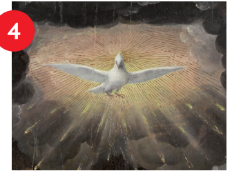
Seguidor de Bernard van Orley, The Pentecost (detalle), circa 1530, óleo sobre panel, 37 1/2 x 43 3/4 in., comprado con fondos del estado de Carolina del Norte.

Un majestuoso cisne se defiende del ataque de un perro durante una cacería. Seguramente, el rey francés Luis XV y su corte estarían encantados con el dramatismo que transmiten las poses de los animales.