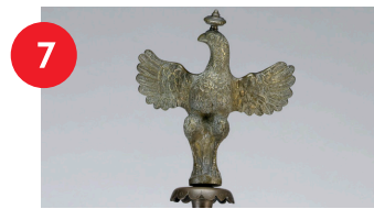
Europa del este, probablemente Galicia de los Cárpatos (en la actualidad, Polonia o Ucrania), Lámpara de pedestal para Janucá para una sinagoga (detalle), 1770/1771 (inscripción), con algunos elementos del siglo XIX, aleación de cobre, Alt. 60 in., regalo de Thomas G. y Louise J. Coffey en memoria de H. Arthur Sandman.

Dos halcones decoran este sarcófago egipcio. Representan a Horus, adorado en Egipto como el dios del cielo, quien protegía a los muertos cuando cruzaban al más allá.