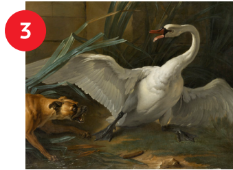
Jean-Baptiste Oudry, Swan Attacked by a Dog (detalle), 1745, óleo sobre lienzo, 70 x 82 in., comprado con fondos de la Sociedad de Arte del estado de Carolina del Norte (legado de Robert F. Phifer).

Esta escena rural muestra un pollo de colores brillantes que parece ser más un amigo que una próxima comida. ¿Qué ave te gustaría tener como mascota?