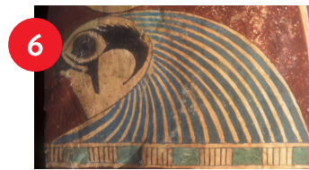
Egipto, probablemente de Heracleópolis, Sarcófago de Amunred (detalle), circa 715-525 A. C., madera con yeso y pintura, Alt. 71 in. x Anch. 19 in. x Prof. 16 3/4 in., donación del Fondo en Memoria de James G. Hanes.

Este pavo aparece en una escena del mercado. Está rodeado de productos agrícolas, como calabacines, habichuelas y calabazas, y su presencia simboliza la abundancia de alimentos que habían descubierto los exploradores holandeses en América del Norte.