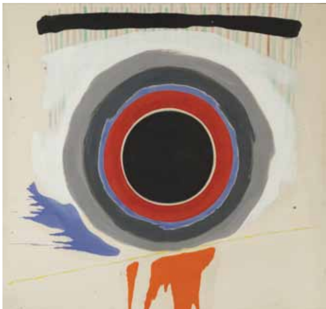
Kenneth Noland, Tide , 1958, acrylic on canvas, 62 7 / 8 × 66 1 / 2 in., Promised gift of Allen and Marianne Mebane, © 2012 Estate of Kenneth Noland/Licensed by VAGA, New York, NY