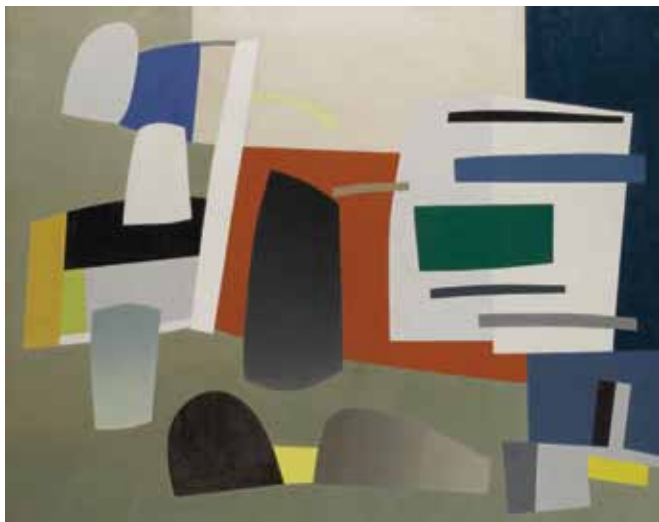
Jean Hélion, Composition , 1934, óleo en tela, 50 15 / 16 × 63 5 / 8 pulg., obsequio de Peggy Guggenheim